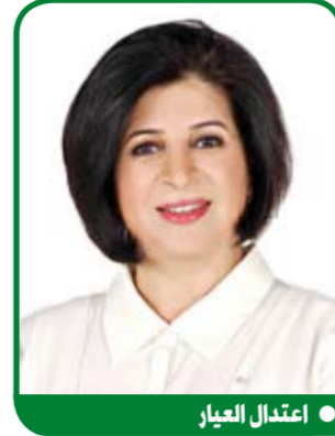
● اعتدال العيار