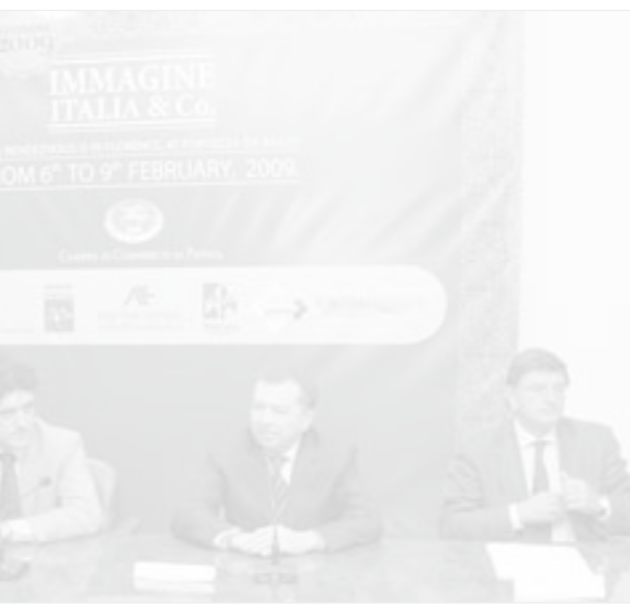
السفير الإيطالي متوسطا الحاضرين في المؤتمر

تم تأمين مساحة اكبر للمعرض تبلغ 30,000 متر مربع (6,000 متر مربع مخصصة لأقسام المنسوجات والأنسجة المنزلية و4,000 متر مربع لأقسام الملابس) وسيتم إقامة المعرض من قبل غرف التجارة والصناعة والزراعة وحرف بيستويا وفريق من الشركاء المرموقين الذين يكرسون مجهوداتهم لإنتاج أفضل المنتجات الإيطالية من المنسوجات المنزلية والأنسجة والملابس وغيرها.