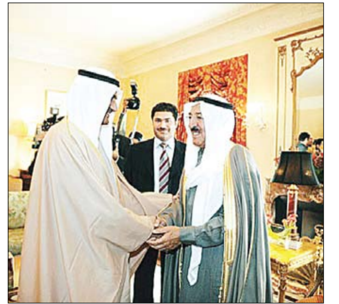
سموه مصافحاً الشيخ حمد بن محمد الشرقي