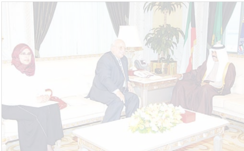
• ولي العهد مستقبلاً حسام الدين سويلم

استقبل سمو ولي العهد الشيخ نواف الأحمد سفير الجمهورية الإسلامية الموريتانية لدى البلاد حمادي ولد أميمو، وذلك بمناسبة توليه مهام منصبه الجديد سفيراً لبلادته لدى البلاد. حضر المقابلة وكيل ديوان سمو ولي العهد الشيخ مبارك الفضل. كما استقبل سموه الخبير العسكري ومدير مركز الدراسات الاستراتيجية للقوات المسلحة المصرية سابقاً اللواء حسام الدين سويلم وذلك بمناسبة زيارته للبلاد. واستقبل سموه الشيخة د. وفاء بدر الملك، حيث أهدت سموه نسخة من رسالة الدكتوراه التي حملت عنوان «الاستجاب البرلماني في النظام الدستوري الكويتي». وقد شكرها سموه، متمنياً لها التوفيق والنجاح.