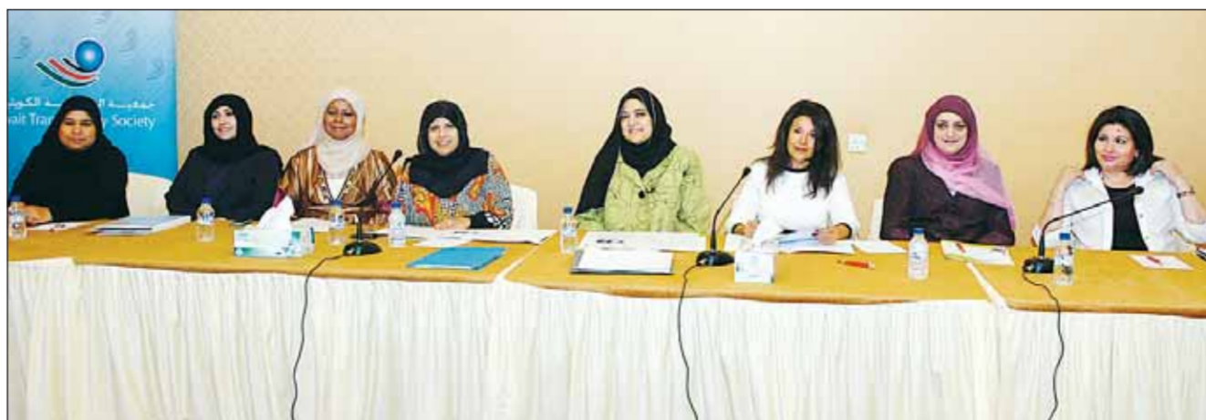
• فريق عمل للتوعية بمرض المرأة الكويتية