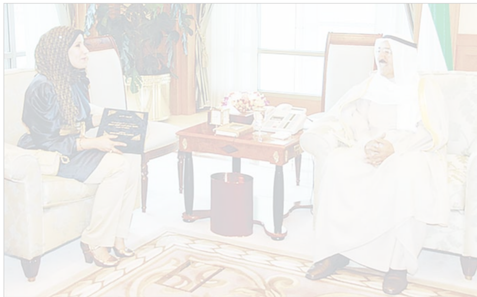
• الأمير مستقبلاً وفاء الملك

استقبل سمو أمير البلاد الشيخة الدكتورة وفاء بدر الملك، حيث أهدت سموه رسالة الدكتوراه التي حملت عنوان «الاستجاب البرلماني في النظام الدستوري الكويتي - دراسة مقارنة».