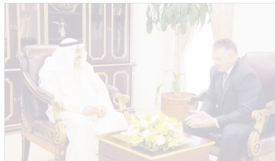
• الخرافي مستقبلاً السفير الروسي

استقبل رئيس مجلس الأمة جاسم الخرافي في مكتبه امس سفير روسيا الاتحادية لدى الكويت الكسندر كينشاك. تم خلال اللقاء تبادل وجهات النظر على الساحتين المحلية والإقليمية وسبل تعزيز العلاقات الثنائية بين البلدين الصديقين.