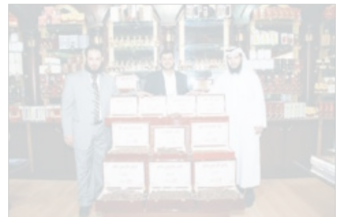
مجموعة من العاملين في جناح «الدر المنثور»