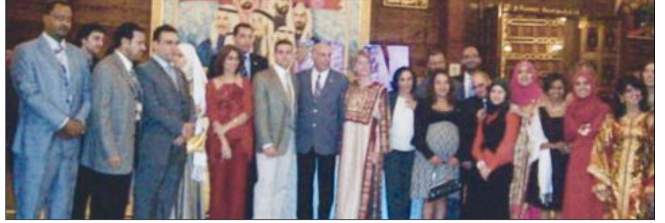
صورة جماعية في الاحتفال

أقامت فالييري كليف ممثلة الأمم المتحدة لدى الكويت حفل استقبال في قاعة الهاشمي بمناسبة الاحتفال بيوم الأمم المتحدة، بحضور وزيرة التنمية الإدارية والتخطيط ووزيرة الدولة لشؤون الإسكان الدكتورة موضي الحمود ومحافظ العاصمة الشيخ علي الجابر ومحافظ الأحمدني الشيخ إبراهيم الدعيح وعدد من سفراء وديبلوماسي الدول العربية والأجنبية والشخصيات الرسمية وسيدات المجتمع ورجال الصحافة والإعلام وإشادت كليف بتقدم البلاد في الالتزام بغايات البرنامج الإنمائي للمنظمة، وهنا الحضور كليف بالمناسبة.