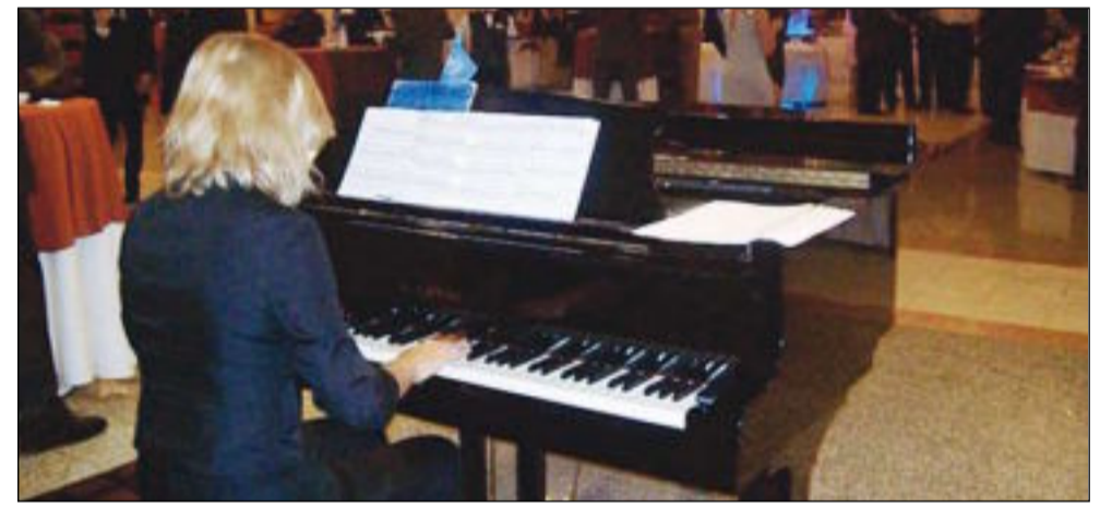
عزف كلاسيكي على البيانو