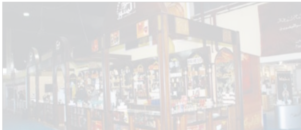
ركن «الدر المنثور»

من السوق المحلي بين مثيلاتها من الشركات المنافسة. من المعروف أن دهن العود والبخور والعطور الشرقية التي تنتجها الشركة تعتمد على استخدام أرقى الأنواع من الخامات الأصلية التي تؤكد جودة المنتج، ويؤكد ذلك ثقة عملاء الشركة في كافة منتجاتها، ومن الجدير بالذكر أن شركة الدر المنثور تشارك سنوياً في معرض الخريف للعطور كما تواظب على المشاركة في معرض مارس من كل عام في أرض المعارض.