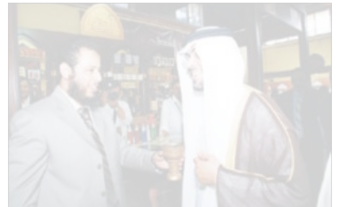
وكيل وزارة التجارة أثناء افتتاحه ركن «الدر المنثور»

شاركت شركة الدر المنثور للعود والبخور في معرض العطور والذي تم افتتاحه يوم 23 أكتوبر الجاري ويستمر حتى الأول من نوفمبر المقبل في أرض المعارض، وطرحت العديد من المنتجات الحصرية والعروض الخاصة وذلك جنباً إلى جنب مع مجموعة العطور التي تتميز بها وتنتجها الدر المنثور.