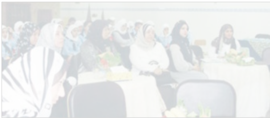
حضور من المعلمات والطالبات

تؤذي خلايا الجسم وكيف يمكن للطعام أن يبطل هذا المفعول الخطير والتأثير الضار لها. ثم أسهب في الحديث عن التغذية الصحية وتأثيرها على أداء الرياضي مفصلاً مقدار السرعات الحرارية اللازمة للرياضي وكذلك أهمية تناول العناصر الغذائية الأساسية بشكل محسوب ومقدر يتناسب واللعب الرياضية التي يمارسها الشخص والحمل الرياضي الذي يتعرض له لكيفية ادائها والقواعد الصحية السليمة التي يجب مراعاتها وقت المنافسة