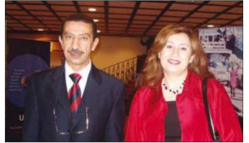
السفير المصري وعقبته