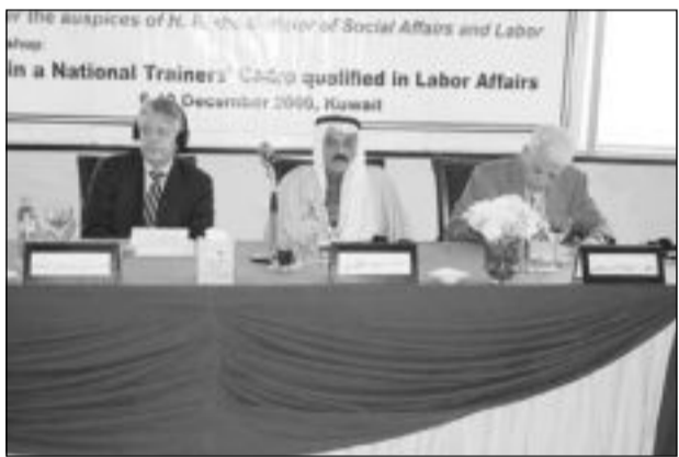
المتحدثون في ورشة العمل