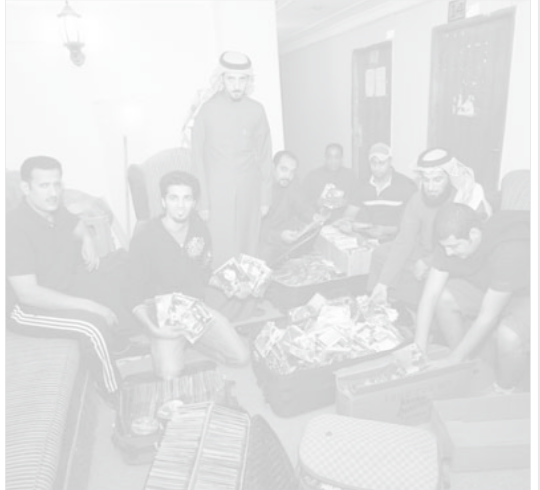
أعضاء فريق المصنفات الفنية أثناء حصر السيديوهات المضبوطة