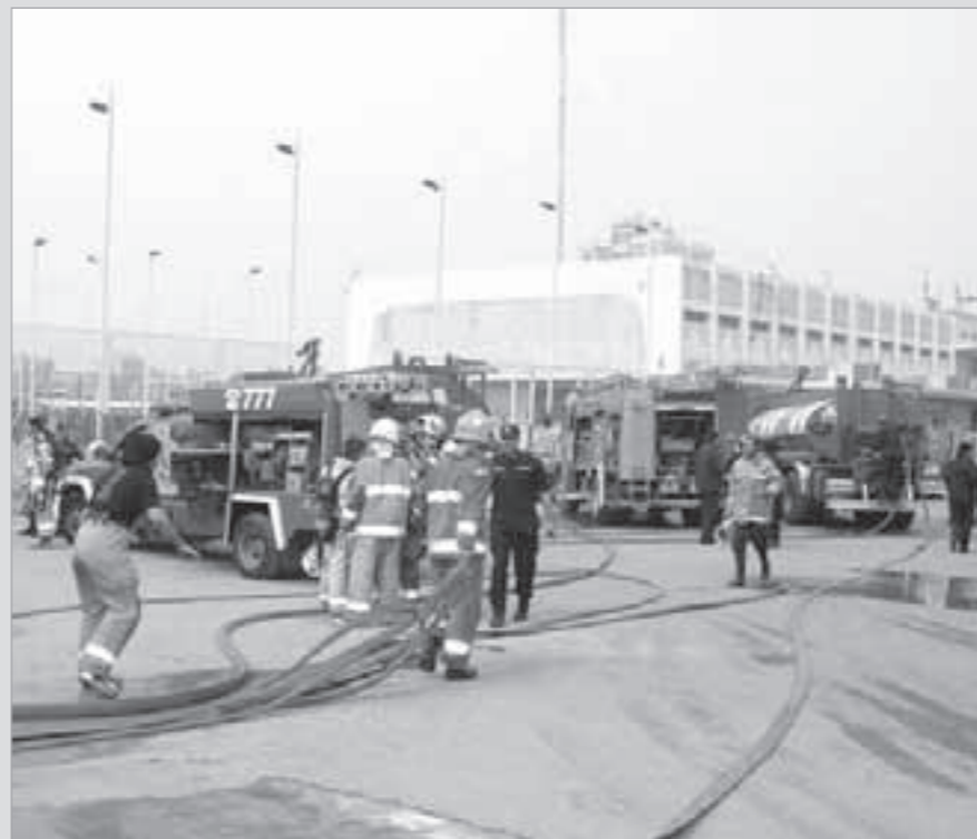
جانب من التمرين الذي اجراه رجال الاطفاء في مبنى الامم المتحدة امس

نفذت الإدارة العامة للإطفاء امس تمرينا عمليا في مبنى الامم المتحدة (اليونيكوم) بهدف رفع جودة وكفاءة الأداء لدى رجال الاطفاء والعاملين في مختلف المنشآت.