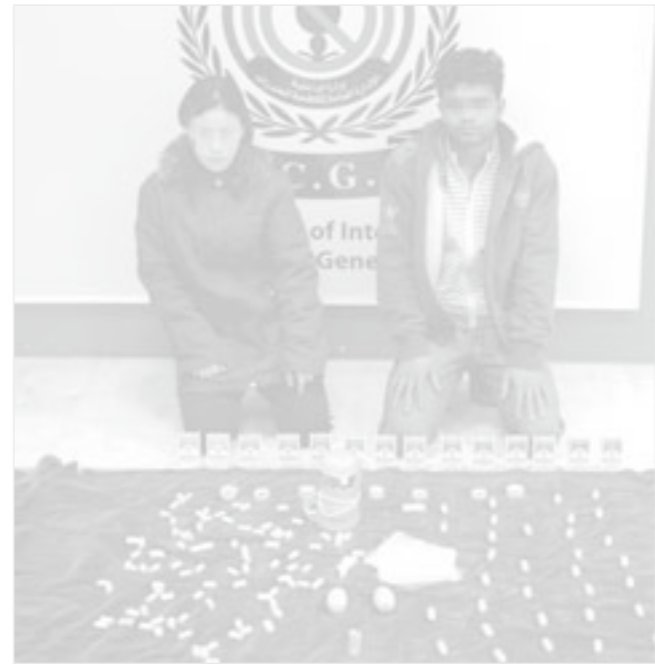
البنغالي وصديقه النيبالية وأمامهما كمية الهيروين المضبوطة

اميركي وضع رجال الإدارة العامة لمكافحة المخدرات بقيادة العميد الشيخ أحمد الخليفة حدا لأحدث طريقة تهريب مخدرات في منطقة الخليج حين تم توقيف وافدة نيبالية وصديقتها البنغالي واعترفا بتهرب الهيروين عن طريق أماكن حساسة بجسد النيبالية وقد عثر بحوزتها على نحو نصف كيلو من الهيروين الخام فيما جار ملاحقة خادمتان قمن بتهرب الهيروين بوضعهما في مكان حساس، ووفق مصدر أمني فإن معلومات وردت إلى العميد الشيخ أحمد الخليفة عن ان وافدة نيبالية (عاطلة) حضرتت على البلاد بفيزا حرة تتاجر بالمواد المخدرة في حولي وكلف المهمة النيبالية ومن وراءها إدارة مكافحة الدولية بقيادة المقدم يوسف الخالدي والرواد مشعل القحطاني وخالد العتيبي وفهد البدر وتمكن الفريق من استدراج النيبالية إلى بيع كبسولة تزن 25 غراما مقابل 500 دينار، حيث تم القبض عليها واعتُرف على صديقتها البنغالي الذي لقي القبض عليه هو الآخر وعثر بحوزتها على نصف كيلو هيروين وقال المصدر ان النيبالية وصديقتها اعترفا بأنهما ينساقان مع تجار