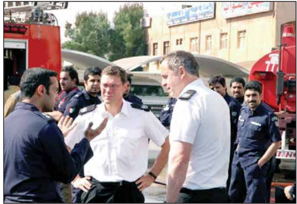
ضباط من بريطانيا مشاركون في التمرين

تطوير أداء قطاع مكافحة بالتعاون مع بريطانيا