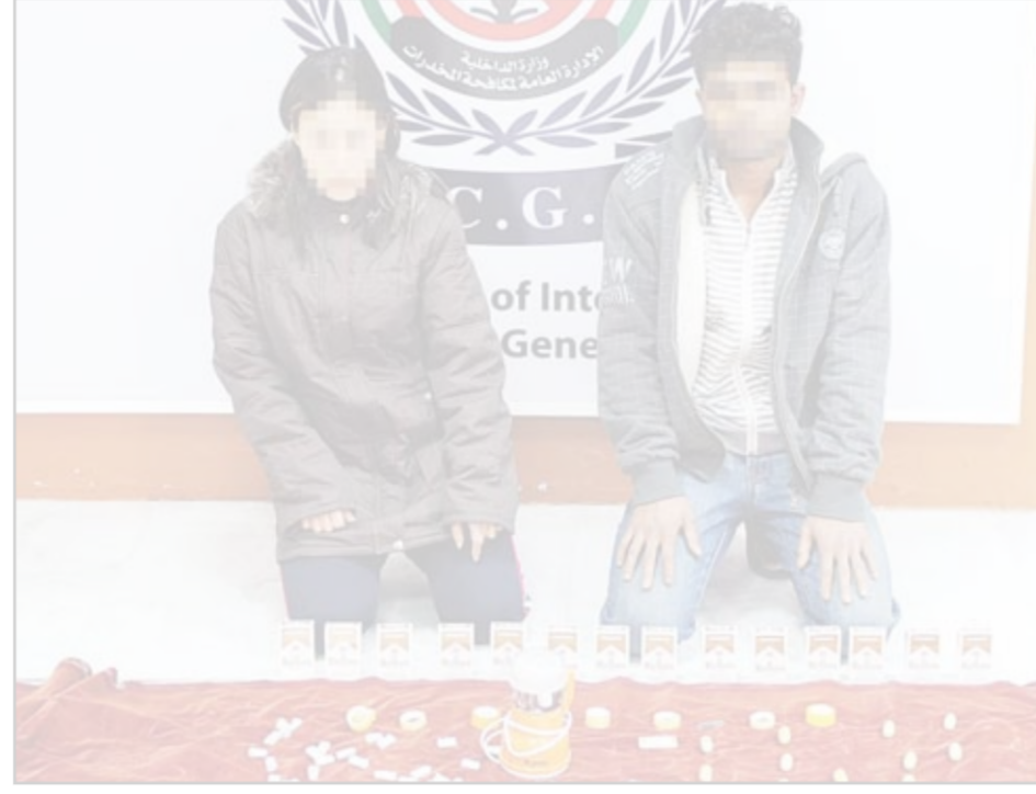
التهمة وأمامهما المبرهنات

وذكر المصدر أن المتهمين اعترفا وبعد تحقيقات مكثفة معهما اعترفا بأنهما يستغلان الخدمات اللواتي يأتين إلى الكويت في تهريب مادة الهيرويين المخدرة داخل بيض كبير الحجم ويتم وضعه في أماكن حساسة للغاية داخل اجساد الخادمت حتى لا يتم اكتشافه من قبل أجهزة الرقابة في المطار. من جانبه أكد مدير عام الإدارة العامة لمكافحة المخدرات العميد الشيخ أحمد الخليفة أن هذه الضبطية ما هي إلا دلالة على نجاح سبل مكافحة التي تتبعها رجال المباحث في الإدارة والأجهزة الأمنية المساندة وهي خير دليل على