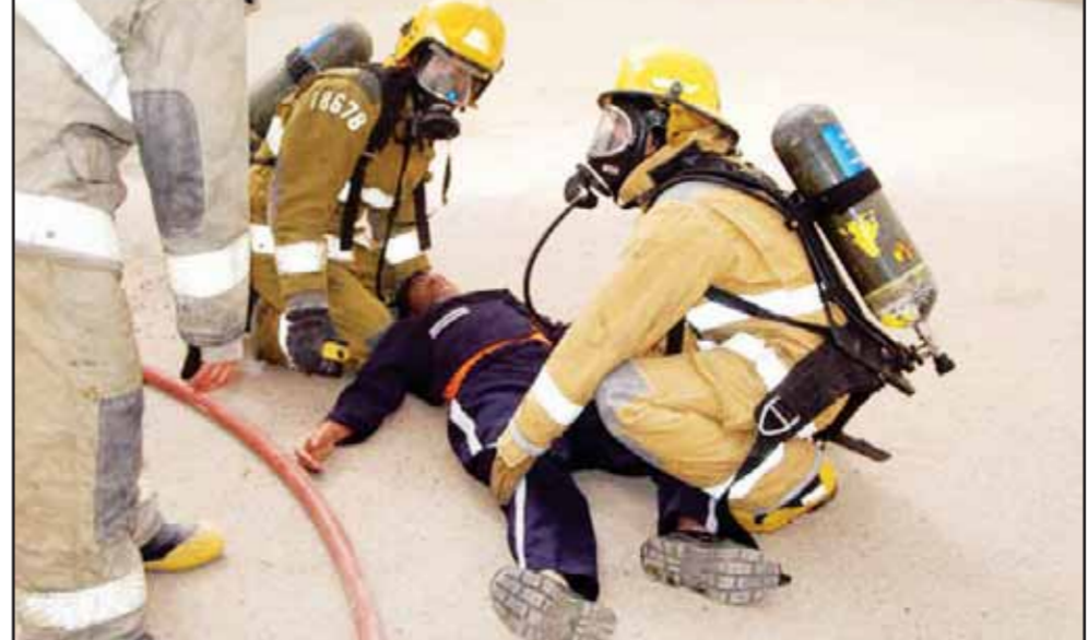
إنقاذ أحد الصابئين

ضباط مركز إعداد رجال الإطفاء والمراكز لفترة تستغرق أربعة أسابيع ومرافقة الخبراء خلال