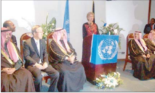
كلمة منسقة برنامج الأمم المتحدة فاليري كليف