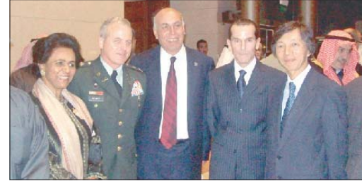
لقطة لبعض الدبلوماسيين

افتتح مقر الأمم المتحدة الجديد في منطقة غرب مشرف الذي أهدته حكومة دولة الكويت إلى الأمم المتحدة بحضور سمو رئيس مجلس الوزراء الشيخ ناصر المحمد والأمراء العام للأمم المتحدة بان كي مون، ومنسق برنامج الأمم المتحدة للإعانة فاليري كليف، والأمين العام للجامعة العربية عمرو موسى، وعدد من أعضاء مجلس الأمة والشيوخ والسفراء ورؤساء المكاتب العسكرية والدبلوماسيين، بالإضافة إلى كبار الشخصيات وسيدات المجتمع ورجال الإعلام والضخامة.