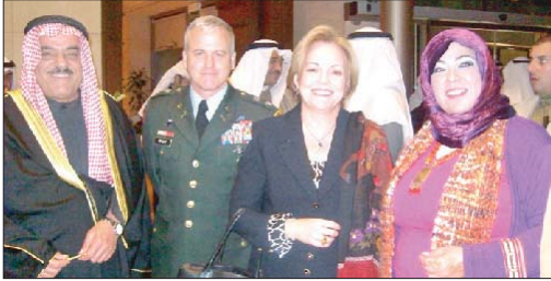
السفيرة الأميركية ديبورا جونز