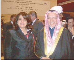
السفير زيد الشريدة وعقيلته