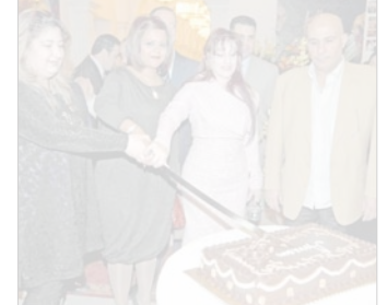
تلع كعكة الافتتاح