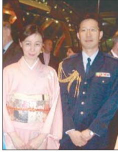
الملحق العسكري الياباني وعقيلته