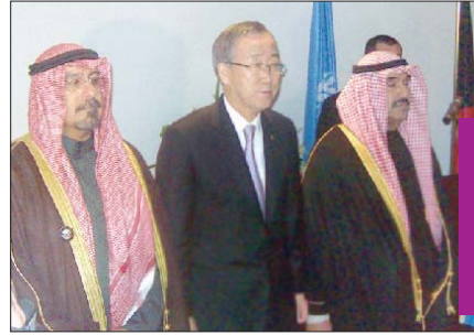
بان كي مون يتوسط ناصر المحمد ومحمد الصباح