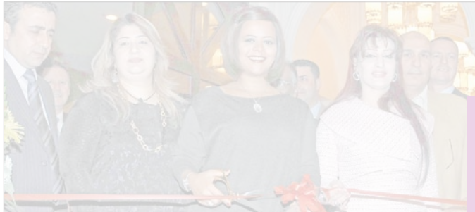
لقطة قص شريط الافتتاح