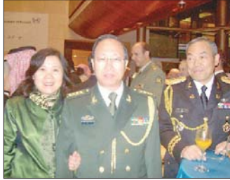
لقطة لرؤساء المكاتب العسكرية