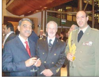
الملحق العسكري الإيطالي يتوسط نظيره الإيراني والبنغلادشي