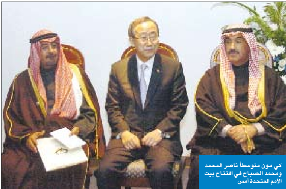
في مون متوسطا ناصر المحمد ومحمد الصباح في افتتاح بيت الامم المتحدة اسس

وأشار إلى أن الهيئة تحرص على المشاركة في هذا الحدث المتميز والاستفادة من الخدمات الإلكترونية الجديدة التي تعمل الهيئة على تقديمها كتظام الاستعلام الصوتي الذي يتم من خلاله الاستعلام عن المعاملة.