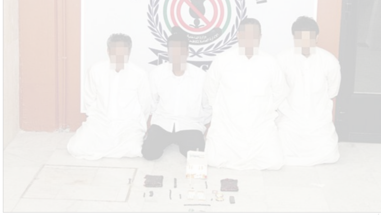
أفراد العصابة الرباعية وأمامهم المنوعات

وعليه أمر العميد الخليفة بتحويل العصابة الرباعية والمواد المخدرة المضبوطة إلى النيابة العامة.