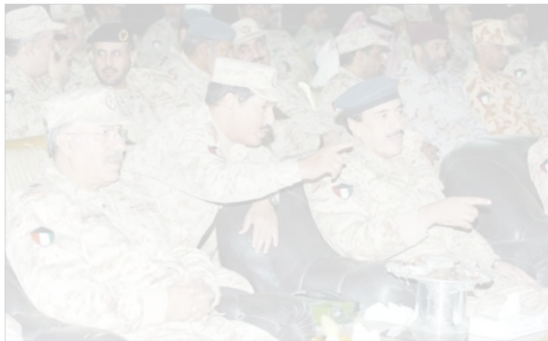
رئيس الأركان يتابع المناورات