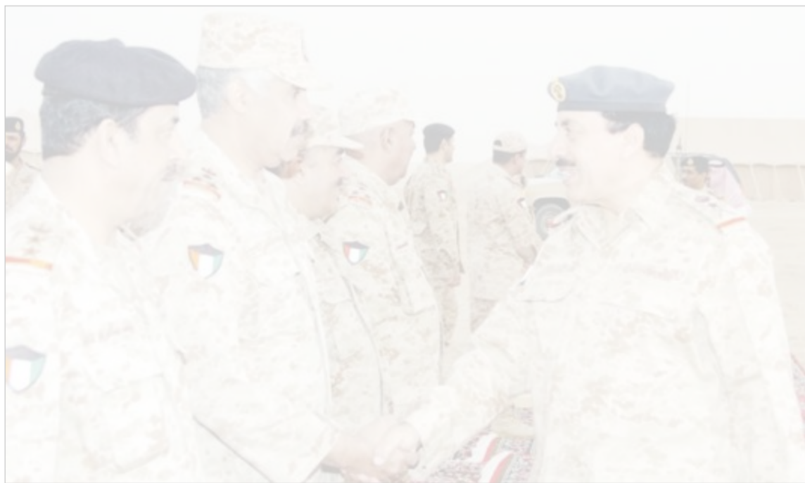
ترحيب برئيس الأركان