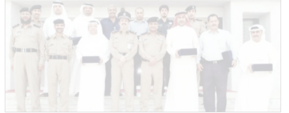
الهاشم يتوسط المكرمين

الماء «إدارة خدمات الطوارئ» ووزارة الصحة «الطوارئ الطبية» وبلدية الكويت «مركز المدينة» بالإضافة الى الشركة العالمية للخيام الفاخرة المتنقلة. وأكد العميد هاشم ان التعاون المتم والبناء بين الجهات المشاركة كان له الاثر البالغ في نجاح جهود الجميع خلال هذه الاحتفالات.