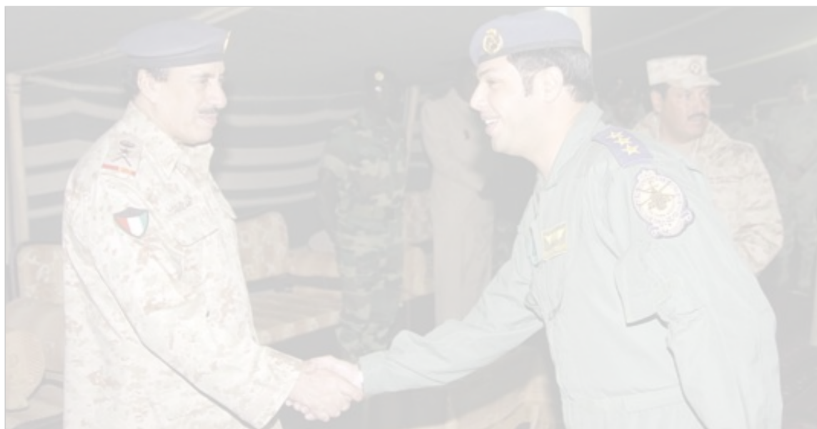
الفريق الركن الأمير يصافح أحد العسكريين