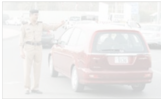
.. والنقيب سعد الجلال