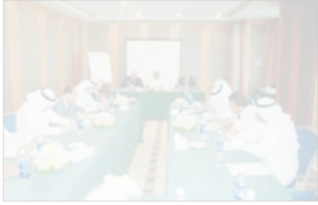
جانب من المؤتمر الصحافي

وقال أن هذه الزيارة ستنكّل بتوقيع اتفاقية مشتركة للتعاون فيما يخص أعمال الصندوق بالإضافة إلى تركيز الجانبين على ضرورة نشر العقيدة الوسطية لدى الشباب حتى نحمي المبادئ الدينية من التشويه أو التضييل