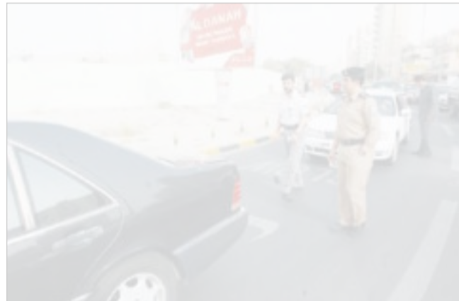
النقيب ناصر الشبعان خلال الحملة