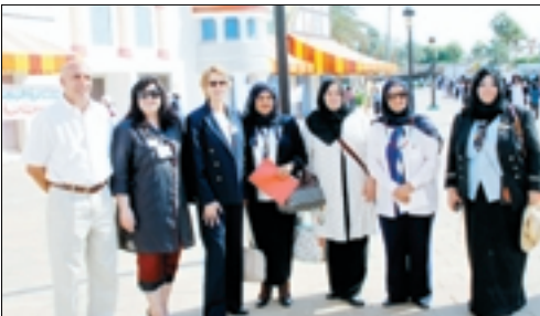
الهولي والظنوع والبعيجان وكليد والغبي وساس