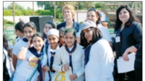
نداء النقي والباري كليد مع المرشدات