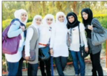
شوق وإيلاء وفخر وتحرير والظلال وشموخ