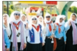
أدى الفعاليات الإرشادية