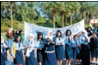
مشاركة منظمة الاممدي