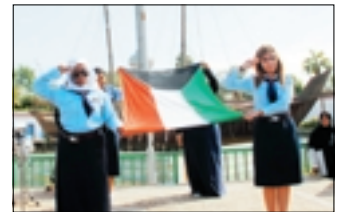
فكرة عرض لعملة العلم