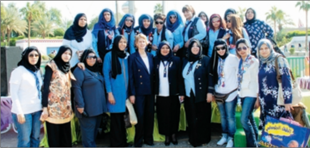
صورة تذكارية في رباب الترفيهية