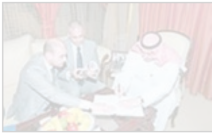
● الشيخ فيصل المالك يوقع الاتفاقية

يذكر ان في الاردن حوالي 2200 طالب كويتي يدرسون في مختلف المعاهد والجامعات في شتى التخصصات.