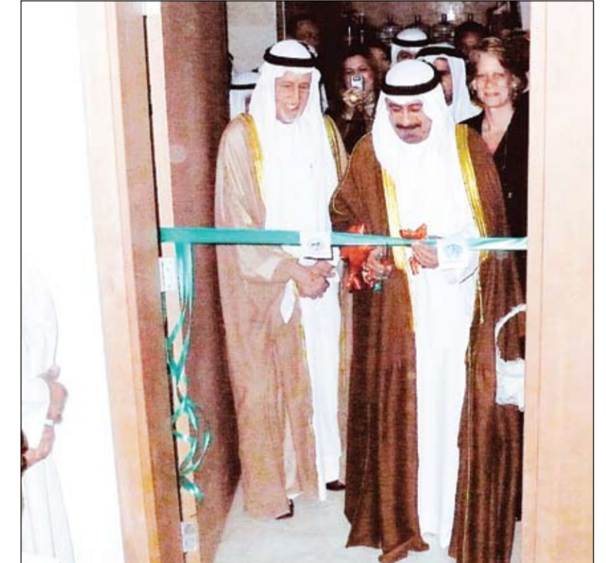
وزير الخارجية مفتحا مكتب «يو. إن. هابيتا» بالشويخ

المكتب ممارسة مهامه ومن بينها التعاون مع المنظمات الاقليمية والدولية ومؤسسات المجتمع المدني والقطاع الخاص والشركاء الآخرين. ولفت الى أن المكتب يمكنه التعاون مع منظمة المدن العربية والشركاء الآخرين في الاعمال ذات الاهتمام المشترك، إلى جانب تنظيم ورش عمل اقليمية ودولية وندوات ودورات تدريبية بخصوص المستوطنات البشرية على أن تكون مفتوحة للمشاركة من الدول الاعضاء. وأردف: «من أجل تحقيق هذه الأهداف وتوفير سبل النجاح للمكتب لمباشرة مهامه قدمت دولة الكويت كل الدعم الممكن على المستوى المادي والمعنوي وهو دعم لا يقتصر على توفير المقر وتجهيزه ولكن بتقديم مساهمة سنوية بمقدار 100 الف دينار خلال السنوات الخمس الاولى من تأسيس المكتب، وكذلك حث الدول الاعضاء