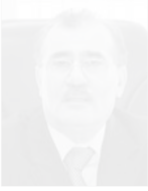
السفير عبدالله المراد

الكويت. وأكد أن الكويت ستلتزم بأي قرار سيخذه مجلس الأمن حول موضوع التعويضات، مبينا أنها مستعدة للجلوس مع العراق تحت مظلة الأمم المتحدة لمناقشة هذا الأمر بما في ذلك بحث مشاريع استثمارية. وأضاف السفير المراد أن كل أعضاء مجلس الأمن الدائمّن الذين اجتمع معهم خلال الأيام القليلة الماضية لنشرح موقف الكويت من القرارين 833 و773 المتعلقين بالحدود الكويتية - العراقية وضرورة صيانة العلامات الحدودية وأمور أخرى عالاقة بين البلدين «أيوا الكويت في أن يظل القرار 833 كما هو».