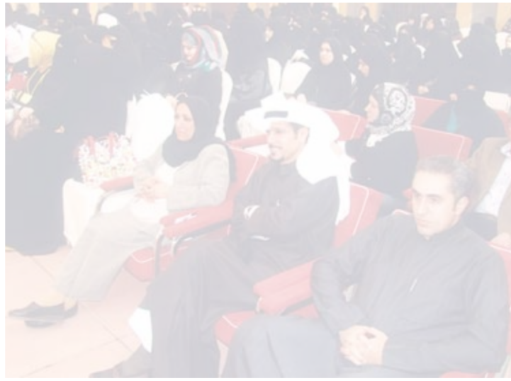
• اولياء الامور