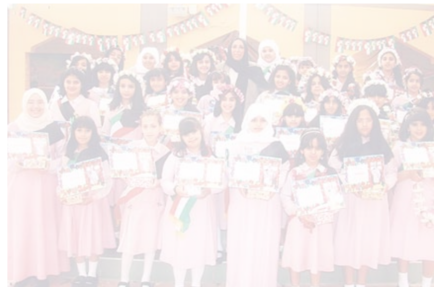
• طالبات الصف الرابع